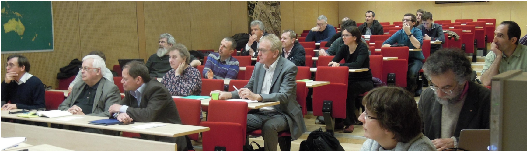
Mars 2015 à l'ENSG Champs sur Marne