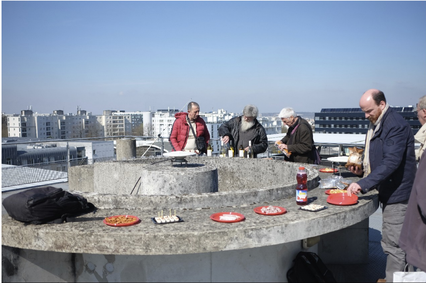
Un évènement dignement fêté

Les nouveaux textes réglementaires (décret/arrêté) sur l'utilisation des références géodésiques en France ont été publiés le 5 mars 2019 au Journal officiel, disponibles sur le site du CNIG ( http://cnig.gouv.fr/?p=20891 ).