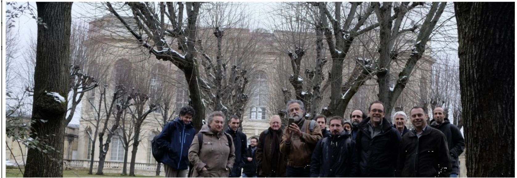
Mars 2018 à l'Observatoire de Paris