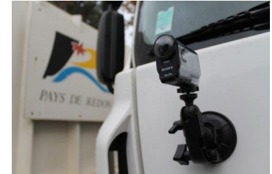
Caméra installée sur les camions de récupération des déchets à Redon