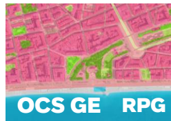
OCS GE RPG